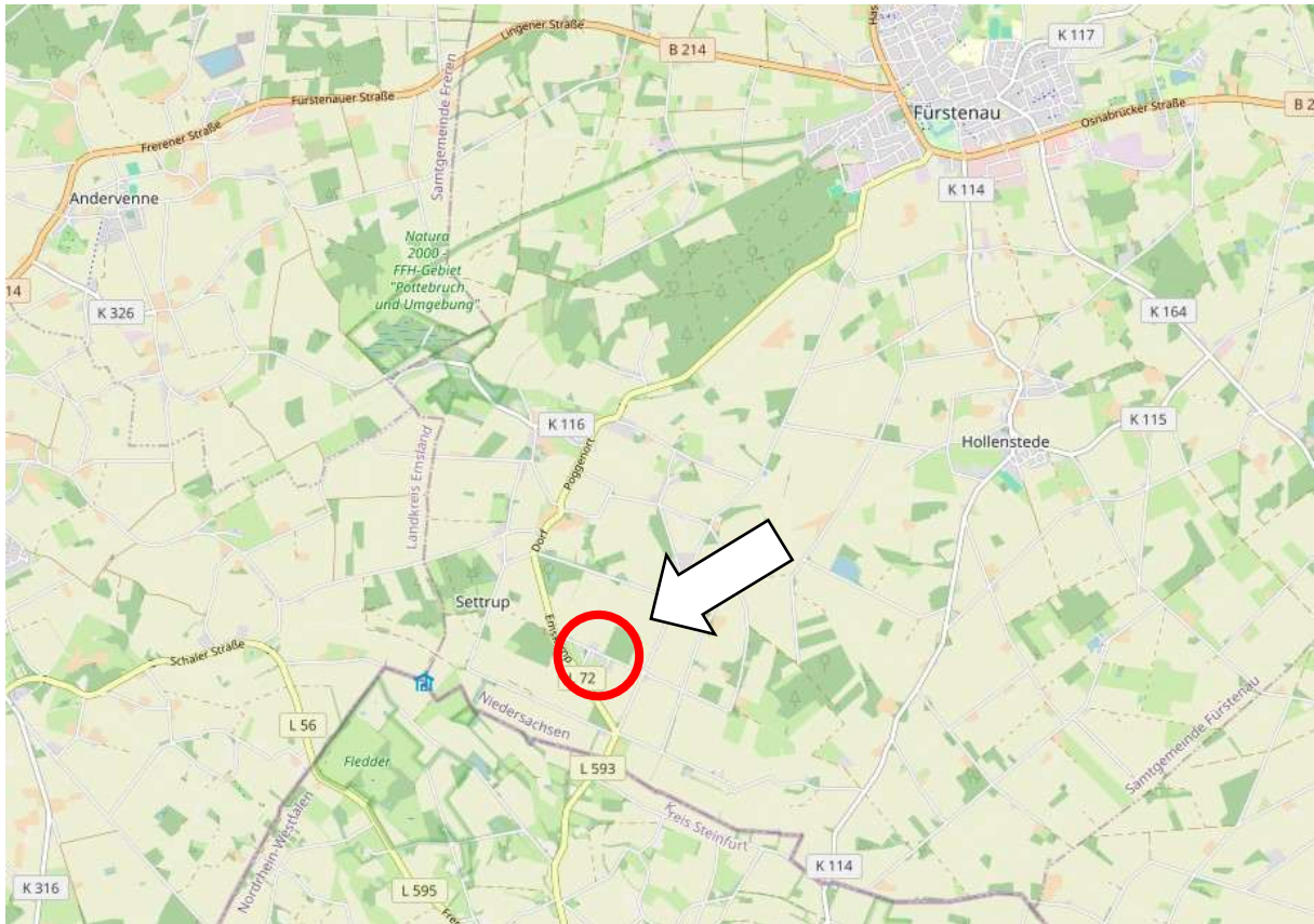
Übersichtsplan ohne Maßstab

Das Plangebiet befindet sich im Südwesten Fürstenaus zwischen den Straßen L 72 „Emskamp“ und „Schaler Damm“ und umfasst eine Größe von ca. 1,08 ha.